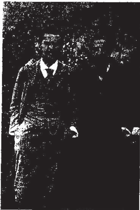
С. Н. Трубецкой и Вл. Соловьевъ

лугъ, рѣшивъ посвятить себя философiи, онъ поступаетъ въ 1881 г. въ Московскій университетъ по историко-филологическому факультету. Оставленный при университетѣ, въ 1885 г. начинаетъ читать лекціи по исторiи философiи. Магистерская диссертация на тему «Метафизика въ древней Греціи» (1890 г.) и особенно докторская работа «Ученіе о Логосѣ» (1900 г.) выдвигаютъ его въ русской философской литературѣ какъ глубокаго мыслителя и оригинальнаго историческаго изслѣдователя. Здѣсь не мѣсто излагать философскія воззрѣнія С. Н. Трубецкого. Его религіозно-философская система близка по духу ученію Вл. Соловьева, съ которымъ связывала его и многолѣтняя личная дружба. Въ рѣдкомъ соотвѣствіи теоретическое міросозерцаніе С. Н. Трубецкого находилось съ природнымъ душевнымъ складомъ его личности: «въ душѣ его жила гармонія, и онъ видѣлъ не-